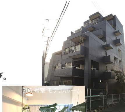
306号室モデルルーム

「すまい」の「いごち」を考える 「すまいごち研究室(モデルルーム)」を 企画しました。ご見学お待ちしております。