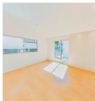
▲ツアーでは家具などが何もない空室画像にAIが自動で家具を配置して生活イメージの湧きやすい画像を作成する(上:空室画像 下:AIによるホームステージング後の部屋)

リコー リコー(東京都大田区)が開発・提供している360度パノラマ画像を活用したバーチャルツアー作成サービス「RICOH(リコー)360 T