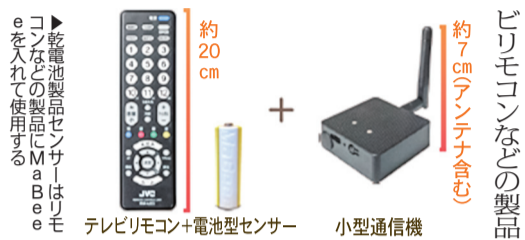
テレビリモコン+電池型センサー

MaBeeは、単4形乾電池を単3型乾電池サイズの専用ケースに入れて使用。MaBeeを利用して製品を使うことで電流を