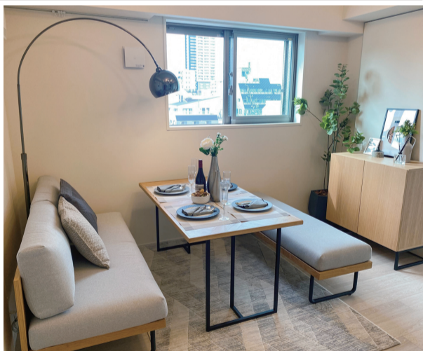
▲クラスがプランニングした「Brillia 浅草橋」の一室

AS(クラス)を2018年4月から提供している。12月現在、40社の不動産会社で導入済みだ。顧客は大手が中心だが、直近では数百から数千戸を管理する会社での利用も急拡大している。不動産会社がクラスにホームステージングを依頼し、現地調査後10日から2週間程度でコーディネートが家具や観葉植物などのインテリア、小物、必要に応じて家電をプランニングし配置する。もともと個人向けに家具・家電のレンタルサービスを行っており、会員約15万人の中から人気の家具・家電の情報を把握している。ターゲット層として多いファミリー層のニーズも網羅しており、常にトレンドや入居者ニーズに合ったホームステージングを行うことが可能だ。